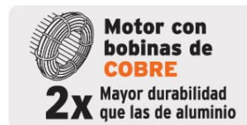
Motor con bobinas de COBRE 2x Mayor durabilidad que las de aluminio